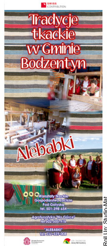
Roll Up: Studio-Mat