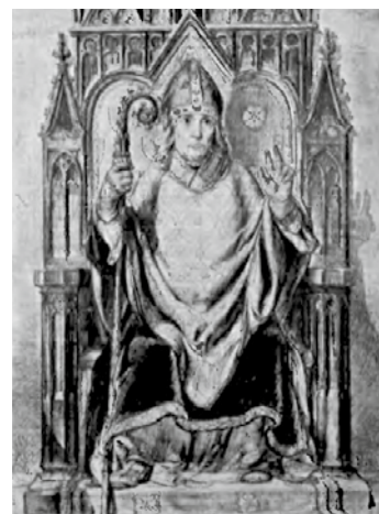
Rysunek: Jan Matejko – Biskup Bodzanta z Jankowa. Rysunek ze starej pieczęci.

Jedną wadę miał biskup Bodzanta, gdyż nadto dbał o powiększenie rodzowego majątku w rodzinnym Jankowie oraz lubował się w „puszczaniu” własnych pieniędzy różnym krewniakom. Wykorzystał to jego bratanek – Zawisza – lekkomyślny hulaka – puszczać wujowe pieniądze na ucieszki – a nie na strykowski zamek w Janowie. Pewnego razu, Bodzanta zechciał ujrzyć nowo wznoszony zamek. Wówczas Zawisza popadł w niebывалы popłoch, gdyż wujowe pieniądze przepuścił. Dotknięty pod koniec życia Bodzanta straszliwym klectwem – ślepotą – obmacywał za przyczyną bratanka mury innego zamku.