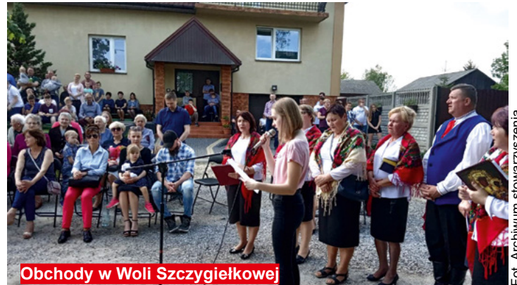
Obchody w Woli Szczygiewkowej