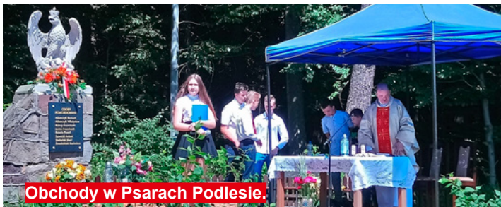
Obchody w Psarach Podlesie