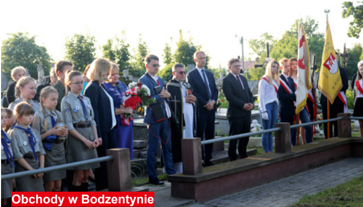
Obchody w Bodzentynie