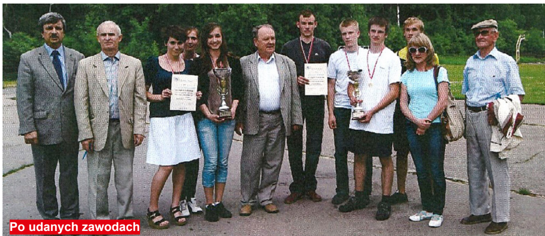
Po udanych zawodach